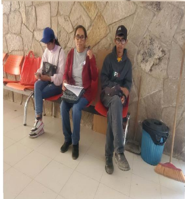
Entrega de lentes para lectura o vista cansada a personas de diferente colonia o comunidad