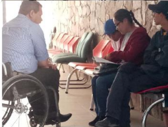
Orientación en tema de agencia laboral, tramites de la Credencial Nacional para Personas con Discapacidad, orientación en tema de discapacidad a personas con discapacidad o familiares de diferente colonia o comunidad.