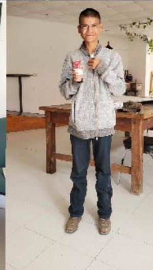
Entrega de su Credencial Nacional para Personas con Discapacidad a personas con diferente discapacidad, de diferentes colonias o comunidades)