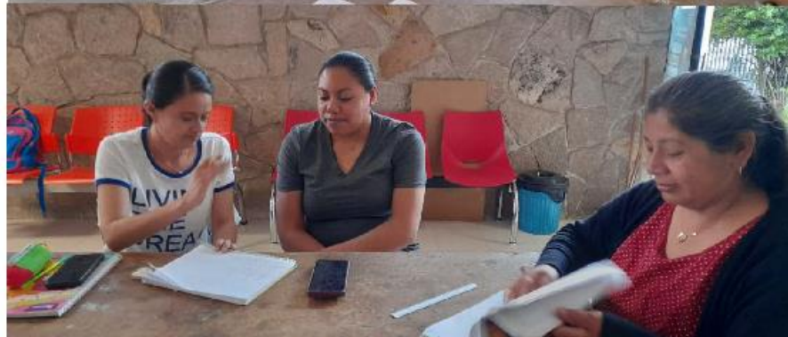
Talleres de Lengua de Señas Mexicana para personas con discapacidad auditiva y familiares de diferente colonia o comunidad.